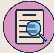
KI und Fake News