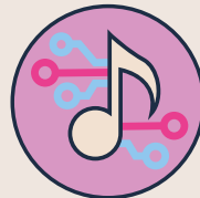
KI und Musik