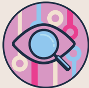
KI und Bilder

Ihre Arbeitsgruppe bearbeitet eines von vier Vertiefungsthemen. Sie beschäftigen sich dabei mit einem ausgewählten Einsatzbereich Künstlicher Intelligenz und setzen sich mit möglichen Gefahren auseinander, um sowohl Chancen als auch Risiken von KI-Anwendungen in diesem Bereich für Kinder und Jugendliche besser verstehen und einschätzen zu können. Tauschen Sie sich anschließend zu den Implikationen für die spätere pädagogische Praxis aus.